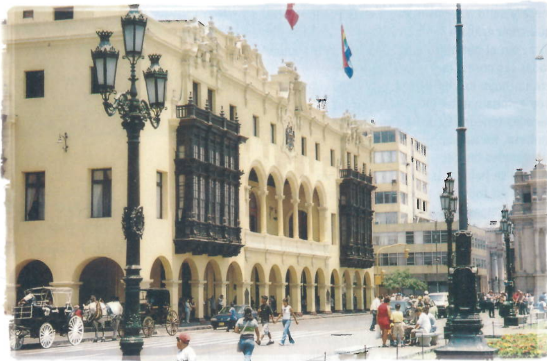
Lima, Perú, ciudad natal de la autora chilena Isabel Allende

La descripción que ofrecemos aquí es lo que vio Esteban Trueba al entrar en la casa de las Tres Marías después de una larga ausencia, un largo tiempo de abandono.