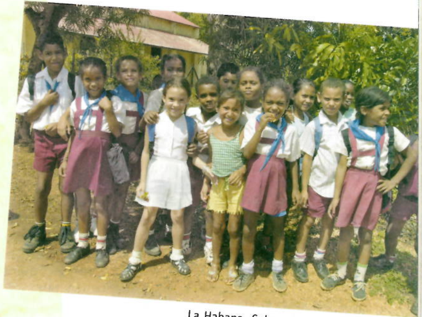
La Habana, Cuba

E En el habla de los negros En este poema Ortiz escribe muchos vocablos según la pronunciación que les da la gente de color de la costa ecuatoriana. Busca como escribe lo siguiente.